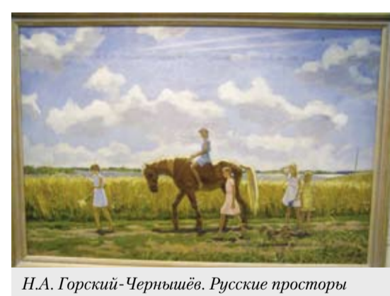
Н.А. Горский-Чернышёв. Русские просторы

Впечатления от многочисленных поездок, осмысление нравственного опыта христианства, обращение к мировой художественной