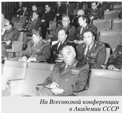
На Всесоюзной конференции в Академии СССР

Такой подход позволил повысить взаимодействие между службами и организациями, ответственность личного состава за состояние